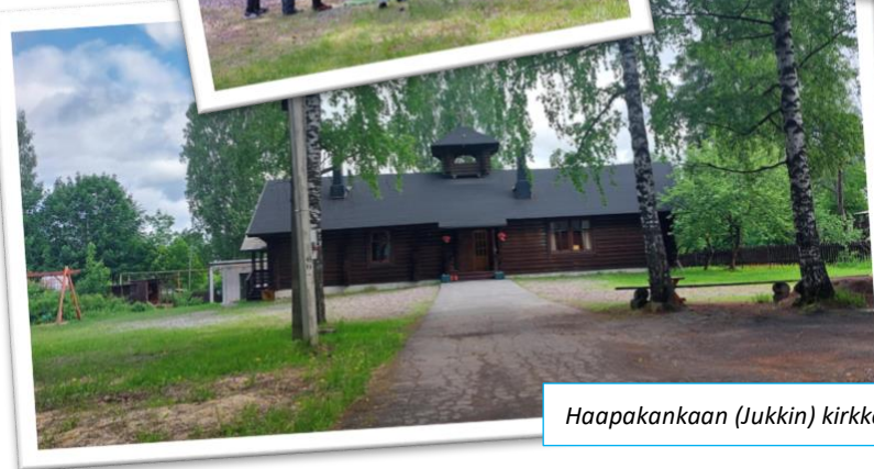
Haapakankaan (Jukkin) kirkko.

"Vallitkoon teidän sydämissänne Kristuksen rauha, johon teidät on yhden ja saman ruumiin jäsenenä kutsuttu. Olkaa myös kiitollisia." Kol. 3:15