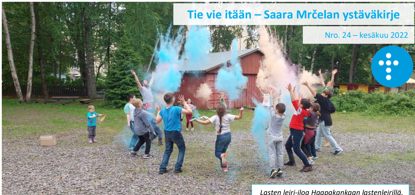
Lasten leiri-iloa Haapakankaan lastenleirillä.